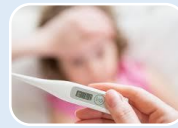
FIEBRE ALTA (38°C por mas de dos dias)